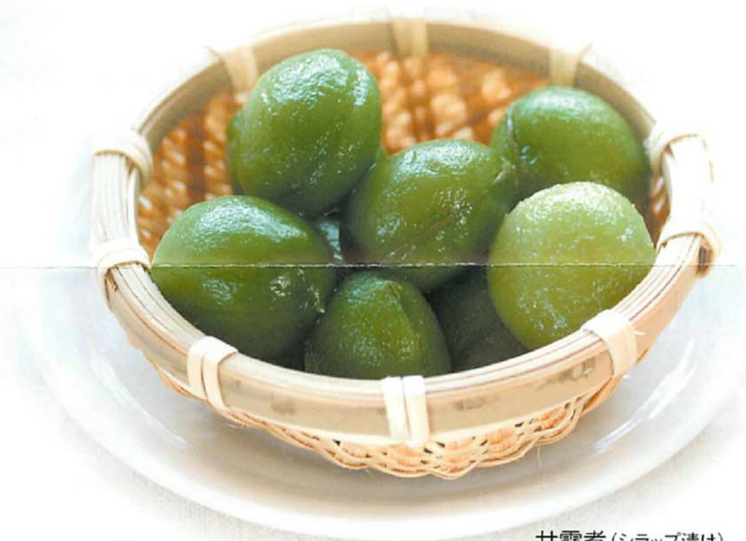
甘露煮(シラップ漬け)