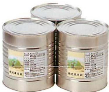
●1号缶 受注生産商品