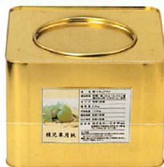
●9号缶 受注生産商品

営業及び事務上に関するお問い合わせ 本社 TEL 0895-45-3777 TEL(IP)050-3456-1266 FAX 0895-45-3778 Eメール inosuya@crocus.ocn.ne.jp 営業担当者は坂出工場にも常駐しております。